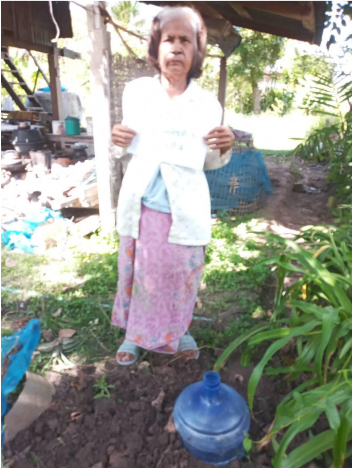
นางจัน ผู้มีสัตย์

เลขที่ ๕ หมู่ที่ ๔ บ้านหนองแคนน้อย ตำบลเมืองจันทร์ อำเภอเมืองจันทร์ จังหวัดศรีสะเกษ