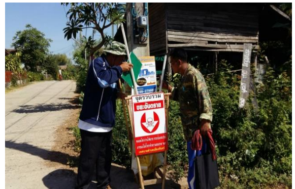
- สำรวจและติดตามความเดือดร้อนของประชาชน