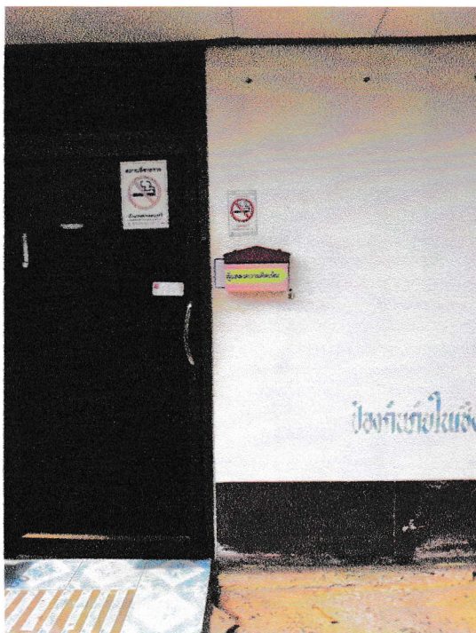
จุดที่ ๒ หน้าห้องศูนย์ อปพร.ทต.มจ.