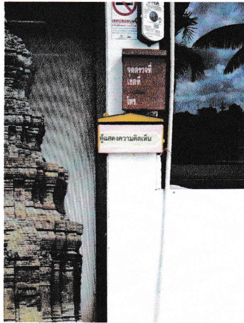
จุดที่ ๑ หน้าเทศบาลตำบลเมืองจันทร์